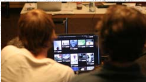
Die Jury beim Bewerten der Bilder